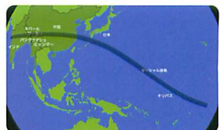
デジタル静止画 & CGクリップ一例